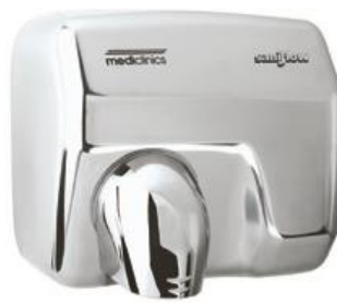
E05AC Acabado brillante