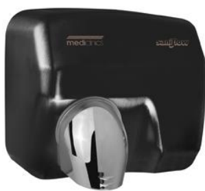
E05AB Acabado negro mate