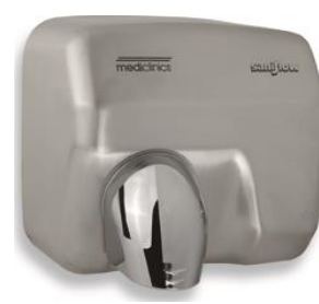
E05ACS Acabado satinado