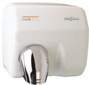
E05A Acabado blanco